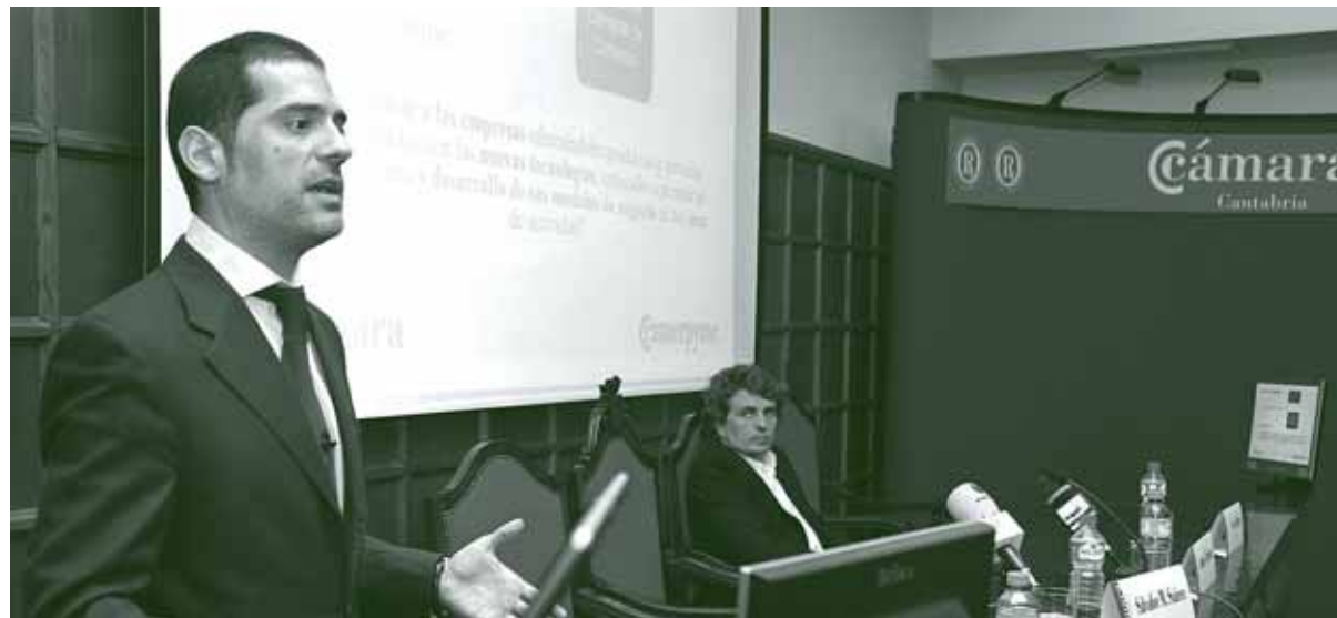
Camerpyme protagonizó una jornada en la Cámara en la que se abordó el presente y el futuro del proyecto.