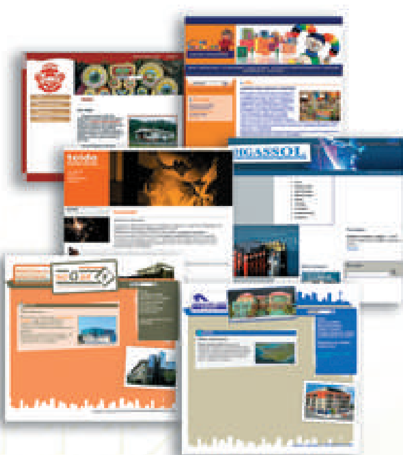
Web de empresas realizadas dentro del programa Maspyme