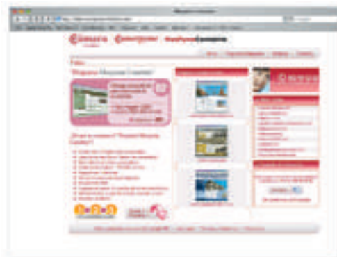
Web de Maspyme

• Entidades colaboradoras: Camerpyme, sociedad participada al 100% por las Cámaras de Comercio.