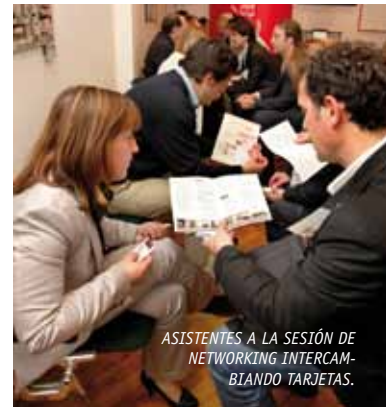
ASISTENTES A LA SESIÓN DE NETWORKING INTERCAMBIANDO TARJETAS.