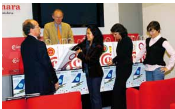
SORTEO ANTE NOTARIO DE LOS TICKETS GANADORES.