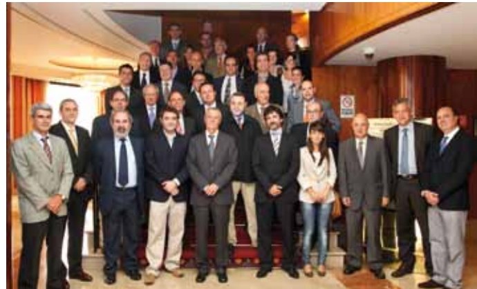
REPRESENTANTES DE LAS EMPRESAS, JUNTO CON EL FUNCIONARIO HOMENAJEADO.