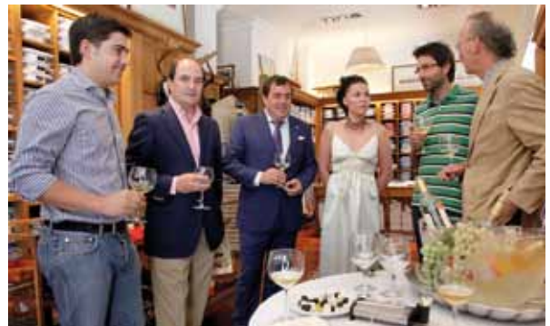
UNO DE LOS ESTABLECIMIENTOS PARTICIPANTES, GOLF, OBSEQUIÓ A SUS CLIENTES CON UN APERITIVO GRIEGO.