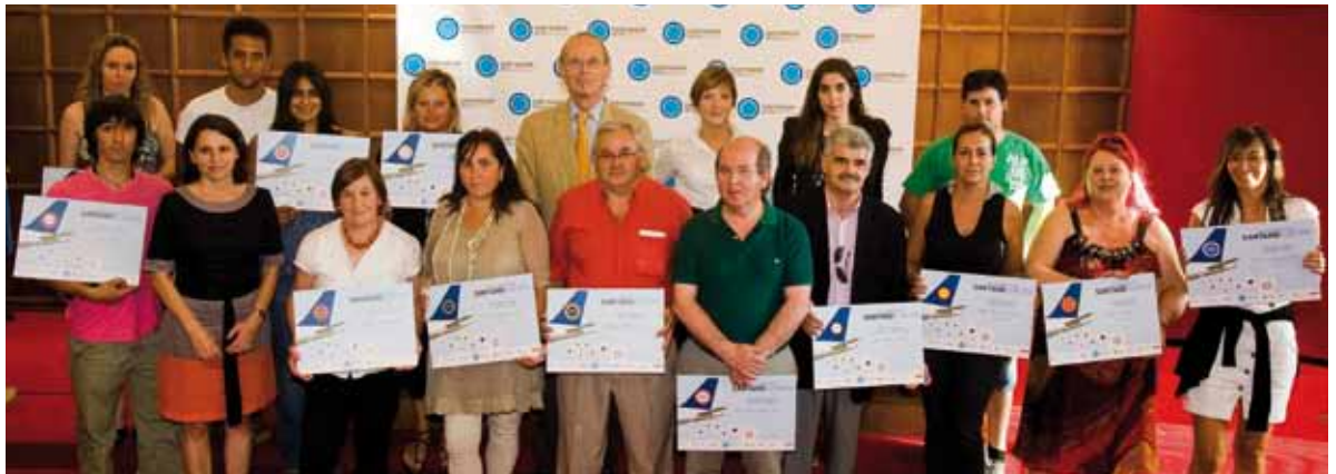
FOTO DE FAMILIA DE LOS PREMIADOS Y LOS ORGANIZADORES.

Durante la campaña "De compras por SANTANDEUROPA" los establecimientos ambientaron sus negocios con motivos que hacían referencia al país de Europa en que simbólicamente se encuentran ubicados. ■