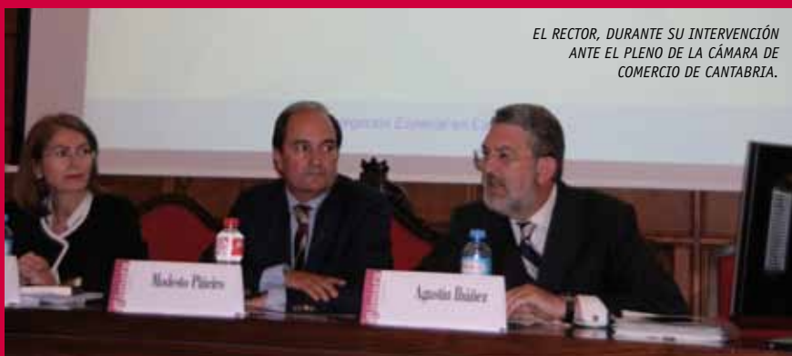
EL RECTOR, DURANTE SU INTERVENCIÓN ANTE EL PLENO DE LA CÁMARA DE COMERCIO DE CANTABRIA.