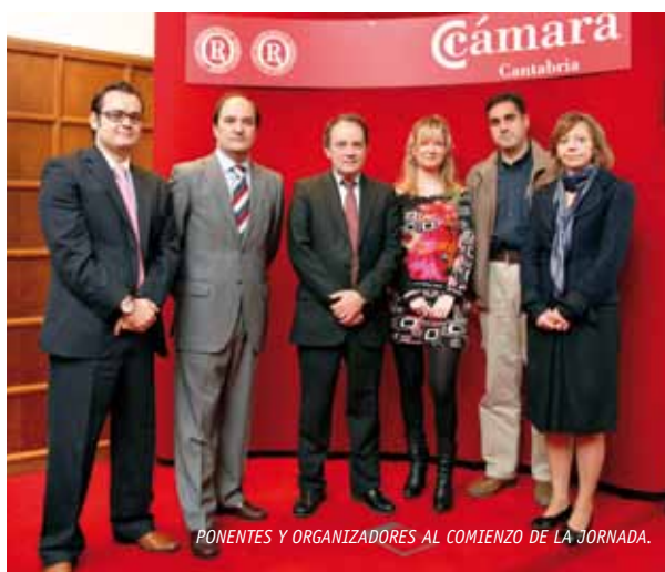
PONENTES Y ORGANIZADORES AL COMIENZO DE LA JORNADA.