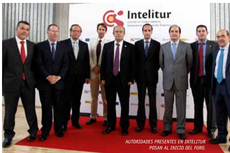
AUTORIDADES PRESENTES EN INTELITUR POSAN AL INICIO DEL FORO.

Con Intelitur las Cámaras hacen una apuesta decidida para contribuir a que el sector turístico español siga siendo líder