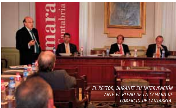
EL RECTOR, DURANTE SU INTERVENCIÓN ANTE EL PLENO DE LA CÁMARA DE COMERCIO DE CANTABRIA.

Dentro del capítulo denominado "Temas de Actualidad Económica a Debate"