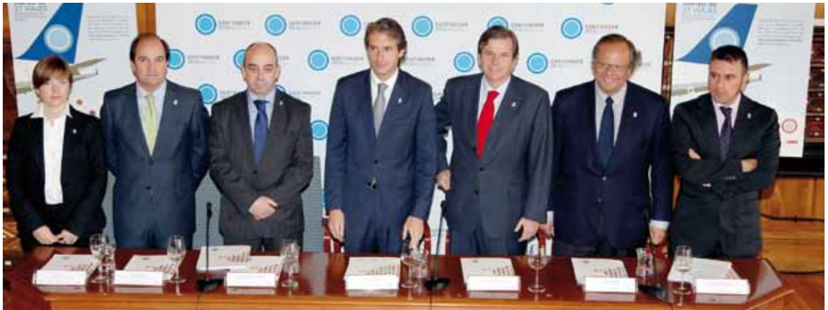
PRESENTACIÓN DE LA CAMPAÑA POR PARTE DE LOS PROMOTORES Y COLABORADORES.