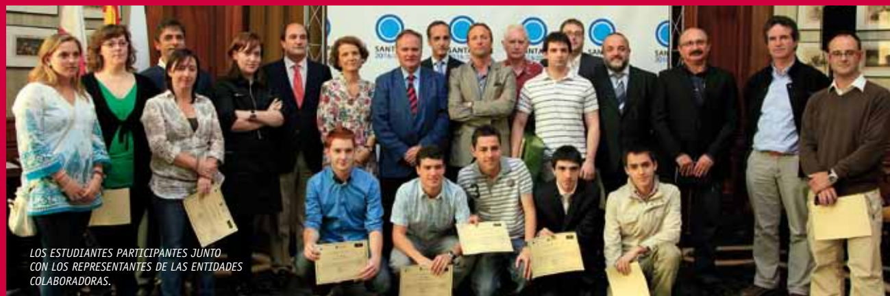
LOS ESTUDIANTES PARTICIPANTES JUNTO CON LOS REPRESENTANTES DE LAS ENTIDADES COLABORADORAS.

sentes representantes de CEOE-Cepyme Cantabria, de la Cámara de Comercio de Cantabria y de La Caixa en Santander, en representación de la empresa patrocinadora del concurso. ■